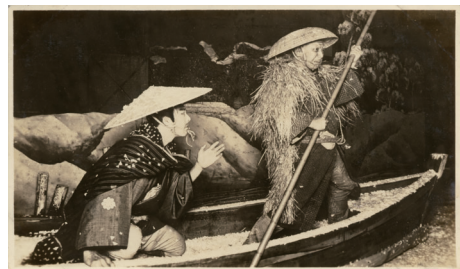
国立劇場所蔵プロマイド 「佐倉義民伝」印旛沼渡し 昭和5年2月明治座