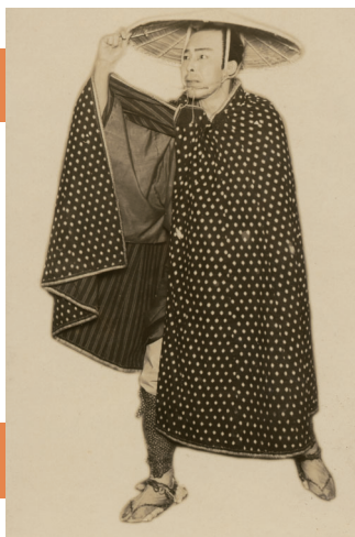
プロマイド 初代中村吉右衛門の宗吾 昭和5年2月明治座