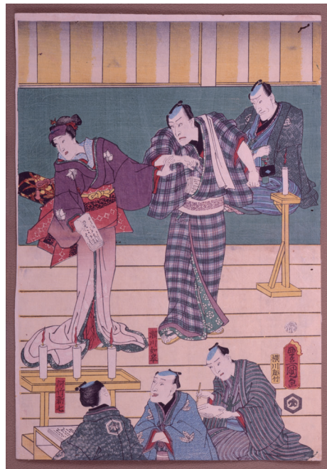
国立劇場所蔵錦絵 「三槍稽古之大会」(部分) 四代目市川小團次(後列中央)と狂言作者の瀬川如阜(前列中央)